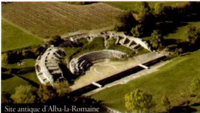
Site antique d'Alba-la-Romaine

Dans la poursuite de cette balade médiévale, le hameau de La Roche se situe au sud-est et en contrebas du village, groupé autour d'un impressionnant neck basaltique ; le roc Saint-Jean, autrefois fortifié (donjon du XII e siècle).